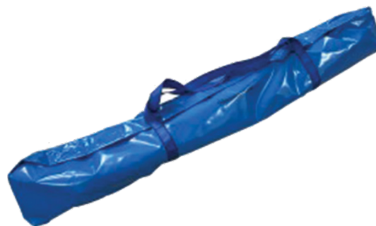
AG_TMC9 + SAC DE TRANSPORT