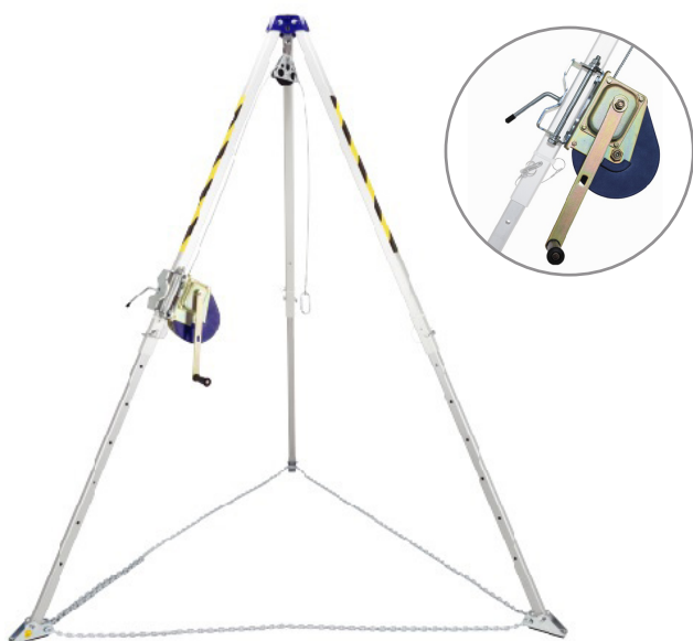
AG_TMC9 + AG_RUC502